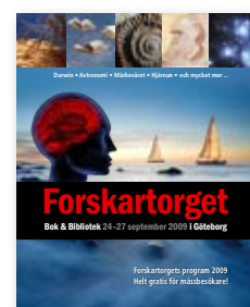
Forskartorget's webb och programkatalog.